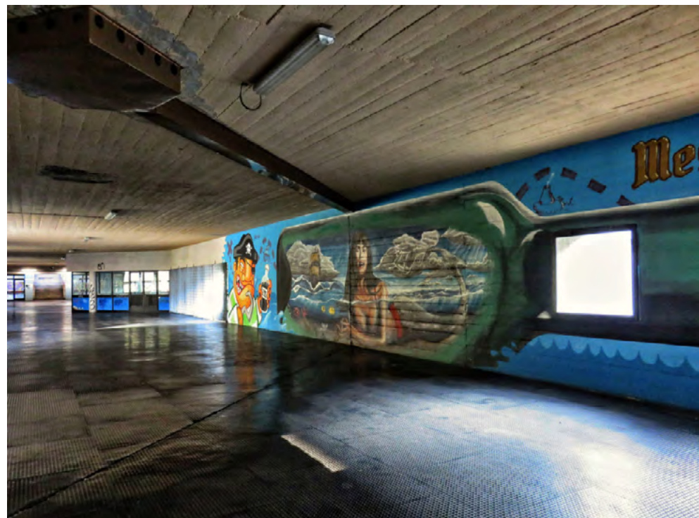
Una delle passeggiate interne di Rozzol Melara a Trieste.

< Per maggiori informazioni > kallipolis.net/progetti/laru-laboratorio-rigenerazione-urbana-2017/